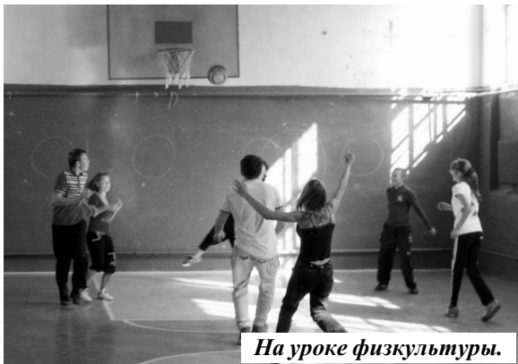
На уроке физкультуры.