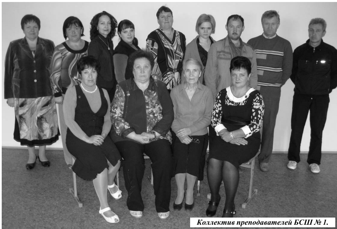
Коллектив преподавателей БСШ № 1.